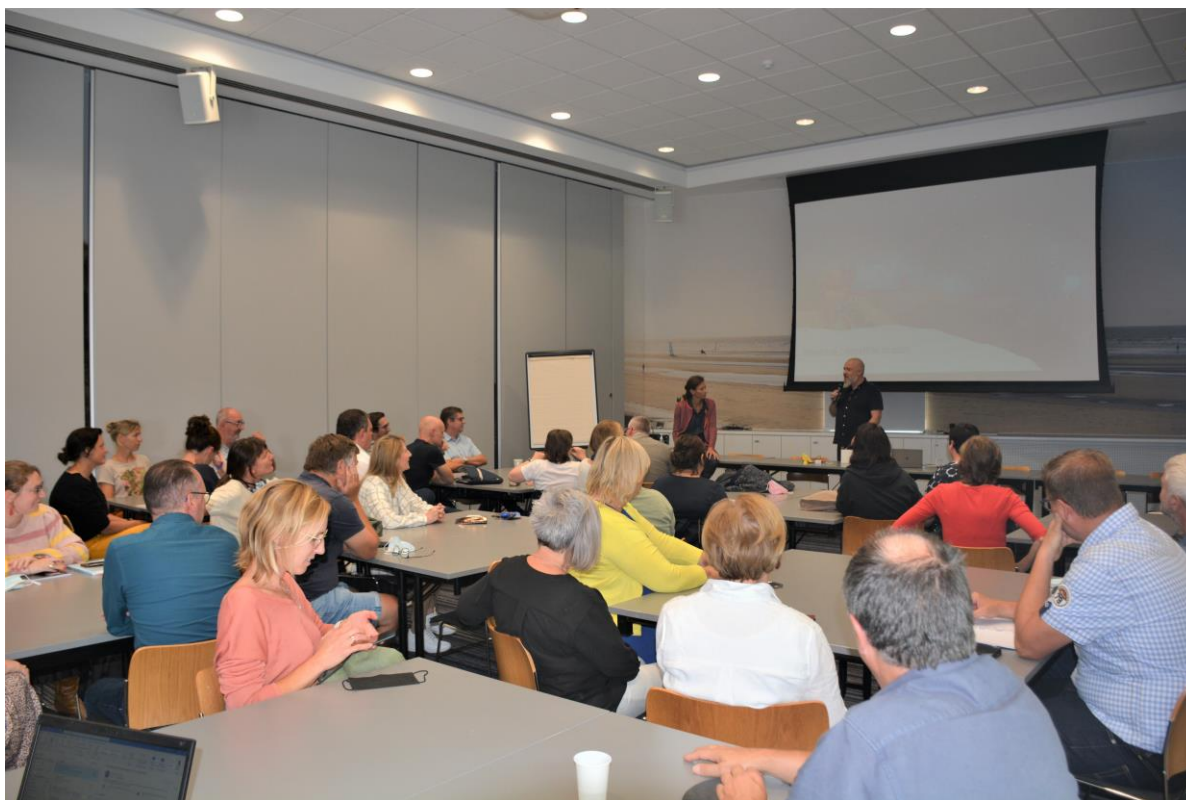
Starttweedaagse pedagogische begeleiding en Vicariaat Onderwijs 1 september 2021.

Het 'inhoudelijke aanbod' wordt volledig door de verschillende diensten ingevuld en georganiseerd. Daarnaast blijft de PB regionaal een aantal congressen en 'dagen van' organiseren, waarbij de inhoud steeds vooraf Vlaanderenbreed gecheckt wordt zodat het zeker is dat in elke regio gelijkaardige informatie gebracht wordt.