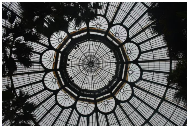
Foto: koepel in de serres van Laken, waar de Koningin Paolaprijs voor het onderwijs werd uitgereikt (zie p. 36).