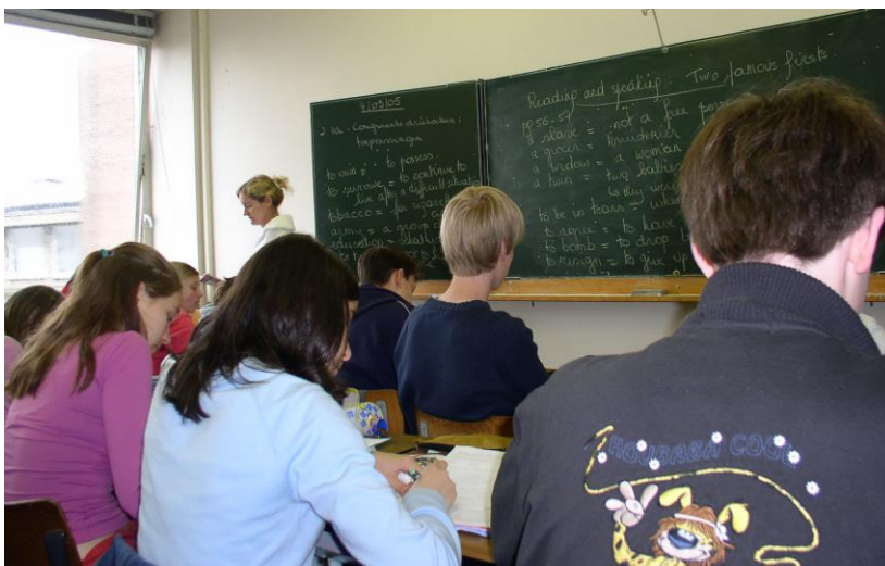
Klas in het Maria-Assumptalyceum Laken in mei 2005.