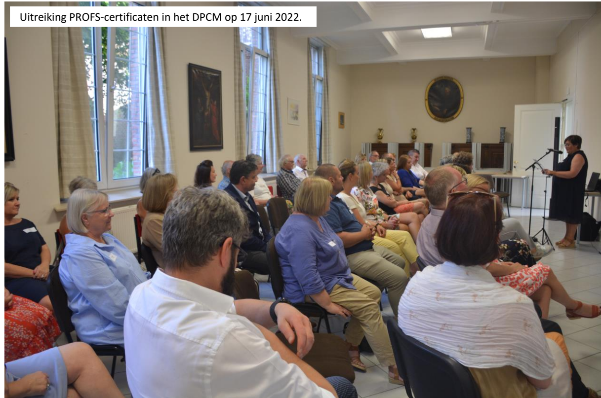
Uitreiking PROFS-certificaten in het DPCM op 17 juni 2022.

Op 3 juni 2022 vond in domein Roosendaal in Sint-Katelijne-Waver de uitreiking plaats van de Profs-certificaten aan 20 directeurs basisonderwijs die in juni 2021 waren 'afgestudeerd'. Omwille van corona werd de plechtige uitreiking uitgesteld.