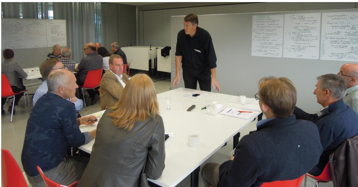
Denkdag BOS in Mechelen op 22 oktober 2016.

Ter voorbereiding van dit agendapunt hadden de COBES-leden nog het eindrapport met evaluatie van het Vlaanderenbrede BOS-proces kunnen doornemen. De voorzitter peilde naar hun reacties en ervaringen met het BOS-proces: