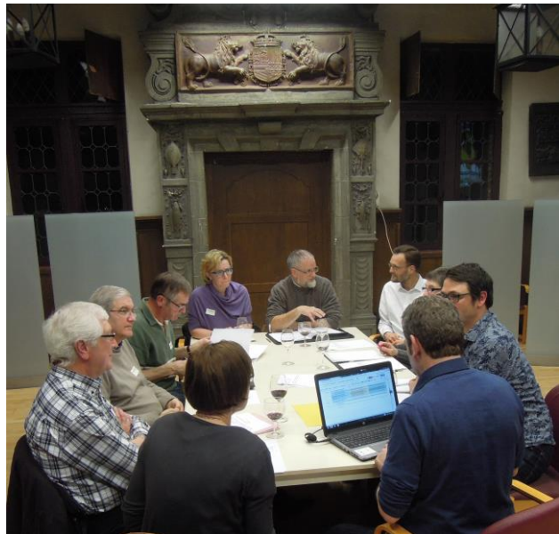
BOS-overleg in Abdij van Kortenberg op 3 februari 2016.