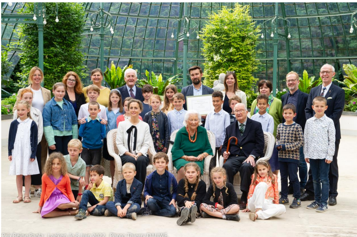
Prix Reine Paola - Laeken, le 8 Juin 2022

Op 8 juni 2022 werd de Koningin Paolaprijs voor het onderwijs 2021-2022 uitgereikt. Ditmaal kwamen leraren en lerarenteams van het gewoon en buitengewoon kleuter- en lager onderwijs in aanmerking vanuit de invalshoek 'Creativiteit en Innovatie'. We waren blij te vernemen dat een katholieke school