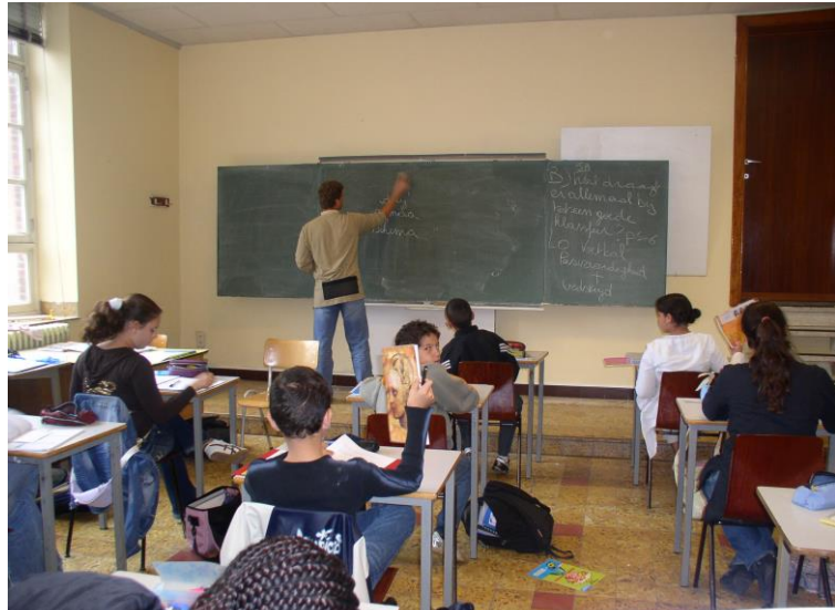
Klas in het Regina Pacisinstituut Laken in 2005.

Er is nood aan creativiteit, maar dat staat in spanning met de verschillende verlofstelsels (die vaak een recht zijn) en de (toegenomen) eisen van leraren