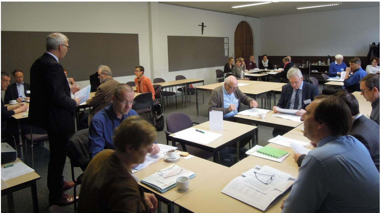
Overlegdag met schoolbesturen regio Leuven in La Foresta op 25 april 2016.

Met het oog op de Raad van Bestuur van Katholiek Onderwijs Vlaanderen van 19 mei 2022 wilde de voorzitter een aantal aandachtspunten voor BO(S)-begeleiding in de toekomst formuleren. "We zijn immers een ledenvereniging, wat maakt dat leden moeten kunnen aangeven hoe ze ondersteund willen worden", zo stelde hij. Volstaat wat voorgesteld wordt in de nota 'ondersteuning (BOS-) besturen'? Komt dat voldoende tegemoet aan de noden en verwachtingen van besturen?