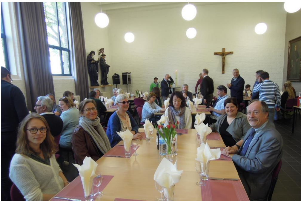
Een deel van de Vicariale ploeg van Mechelen-Brussel tijdens het middagmaal.