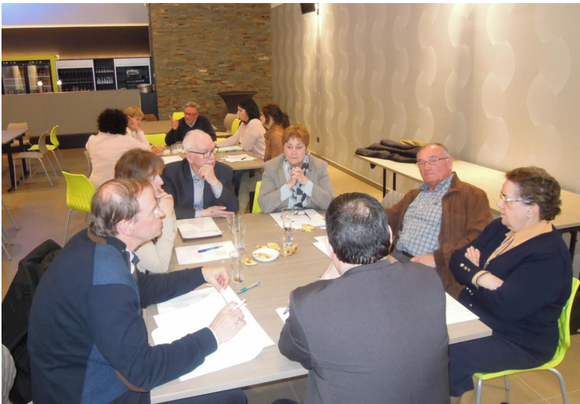
BOS-overleg in Zoutleeuw op 11 april 2016.

De voorzitter schetste een korte geschiedenis van het project van Bestuurlijke Optimalisering en Schaalvergroting (BOS) en vertelde dat de BOS-werf binnen de organisatie beschouwd wordt als 'einde termijn'. Logischerwijs resulteert dit in de opstart van een evaluatieproces, waarbij de organisatie aan de verschillende Comit es Besturen vraagt om hun input en feedback door te geven.